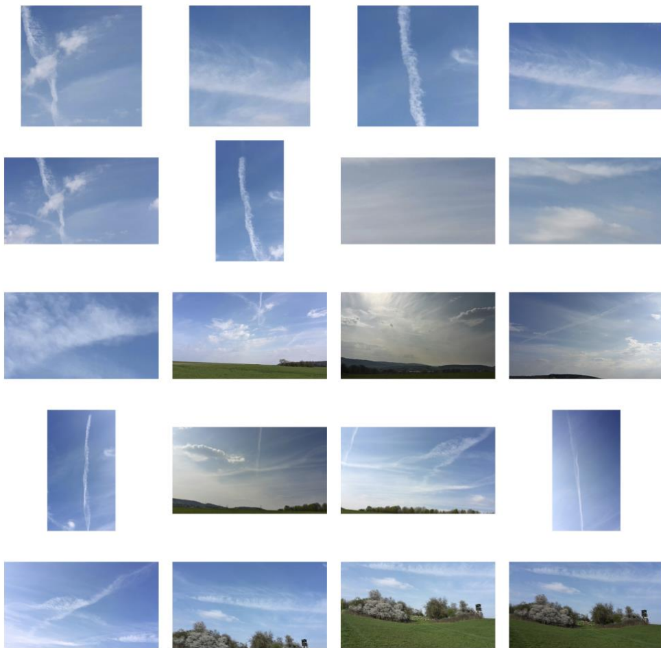
Abb. 1: Post von Rotkäppchen Miezebitz

User_in Rotkäppchen Miezebitz postet am 16. April 2019 zwanzig Fotos in eine Telegram Gruppe. Die Fotos (Abb. 1) zeigen einen strahlend blauen Himmel mit Wolken-Schlieren und teilweise eine hügelige Wiese mit Vegetation. Die meisten Menschen werden hier einen schönen Frühlingstag sehen. Nicht so die Mitglieder der Telegram-Gruppe. Rotkäppchen Miezebitz schreibt zum Post „Warum kann man bloß nichts tun??? / Wer steuert diesen Scheiß? / Innerhalb von kurzer Zeit war der Himmel bedeckt...“ Und damit sind Sie mittendrin in der Chemtrail-Verschwörungstheorie.