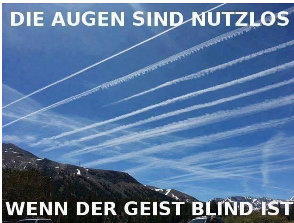
Abb. 6: Post von Apollon

Die Streifen wirken wie Schnitte durch den Himmel. Weitere Kondensstreifen verlaufen oberhalb der Berge und kreuzen die anderen. Umrahmt ist das Bild von dem Schriftzug „DIE AUGEN SIND NUTZLOS / WENN DER GEIST BLIND IST“. Durch die Positionierung am oberen und unteren Bildrand erhält das Bild eine Memeästhetik 21 und gliedert sich in visuelle Online-Diskurse ein.